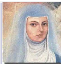
O Cantinho da Joanna

Texto extraído da Revista Reformador –Dezembro 2012